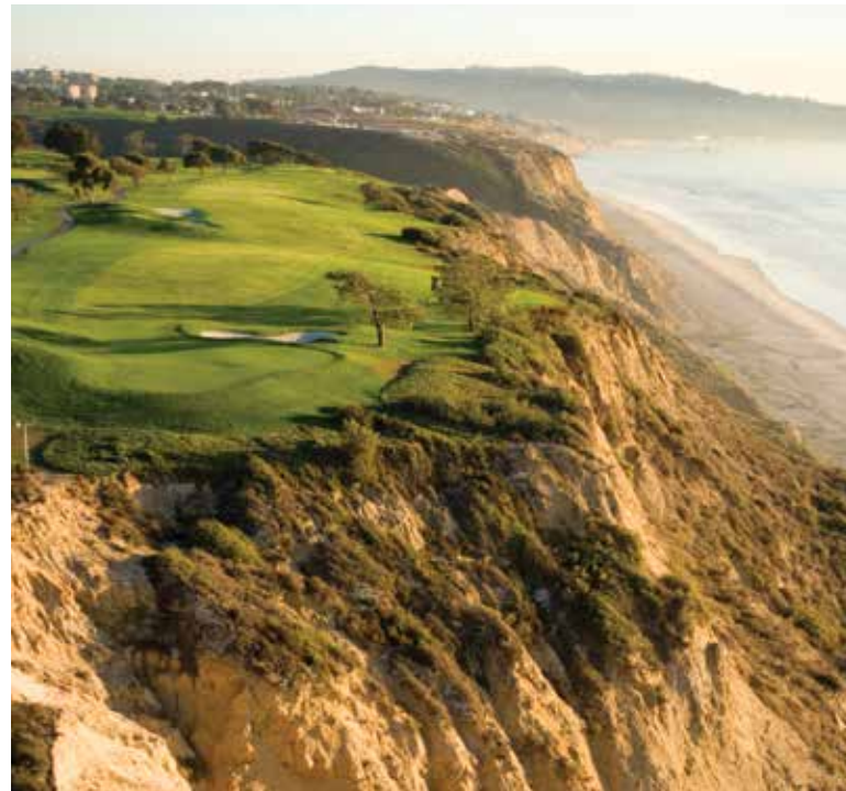
Torrey Pines Golf Course